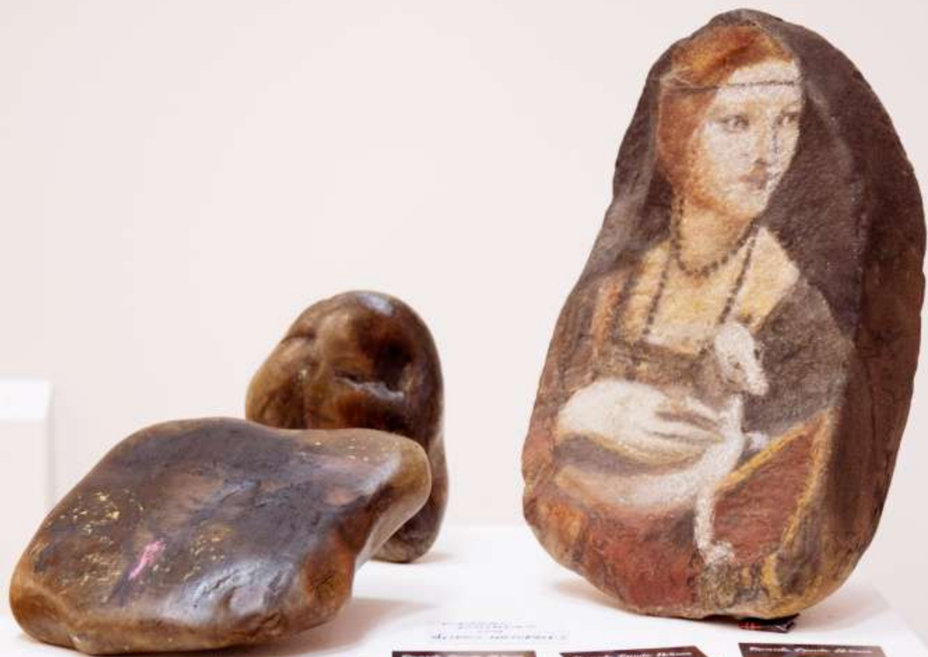
Three ancient rock paintings (petroglyphs) displayed on a white pedestal. The largest painting on the right depicts a woman with reddish hair, wearing a dark shawl and a necklace, holding a white animal. The two smaller paintings on the left show abstract, rounded shapes.