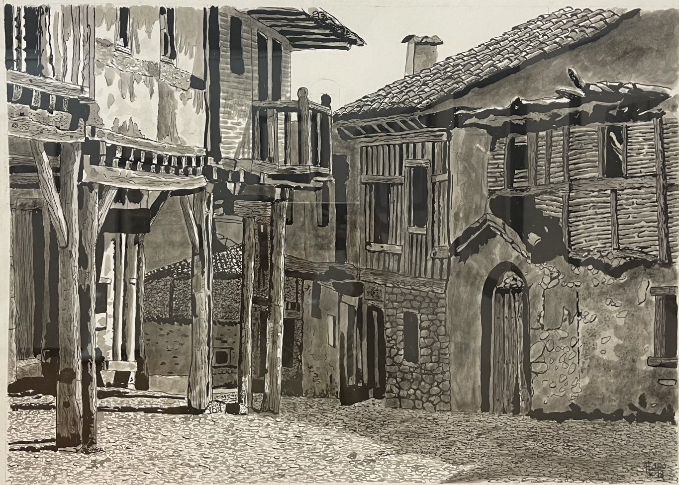
De tu maro.