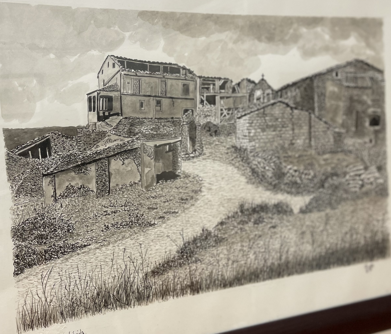
Conill-Despoblado de Lérida.