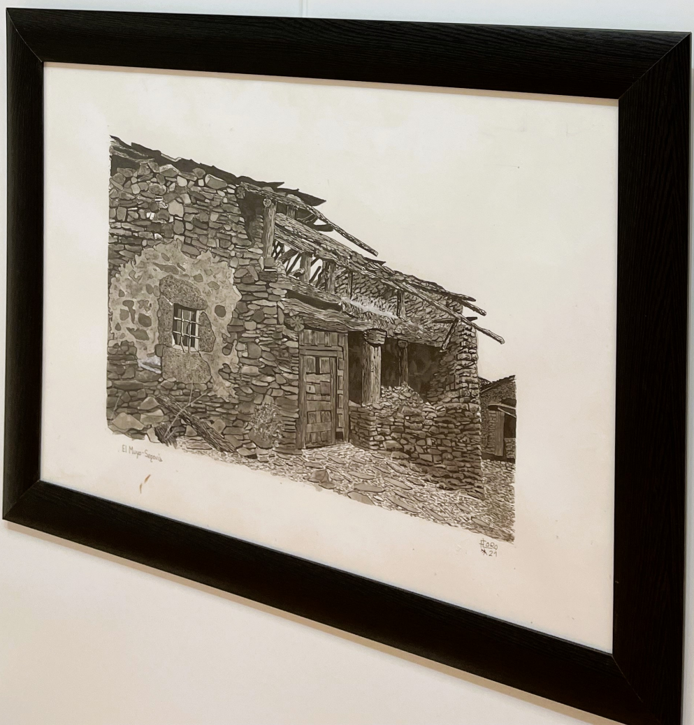
El Museo Segovia