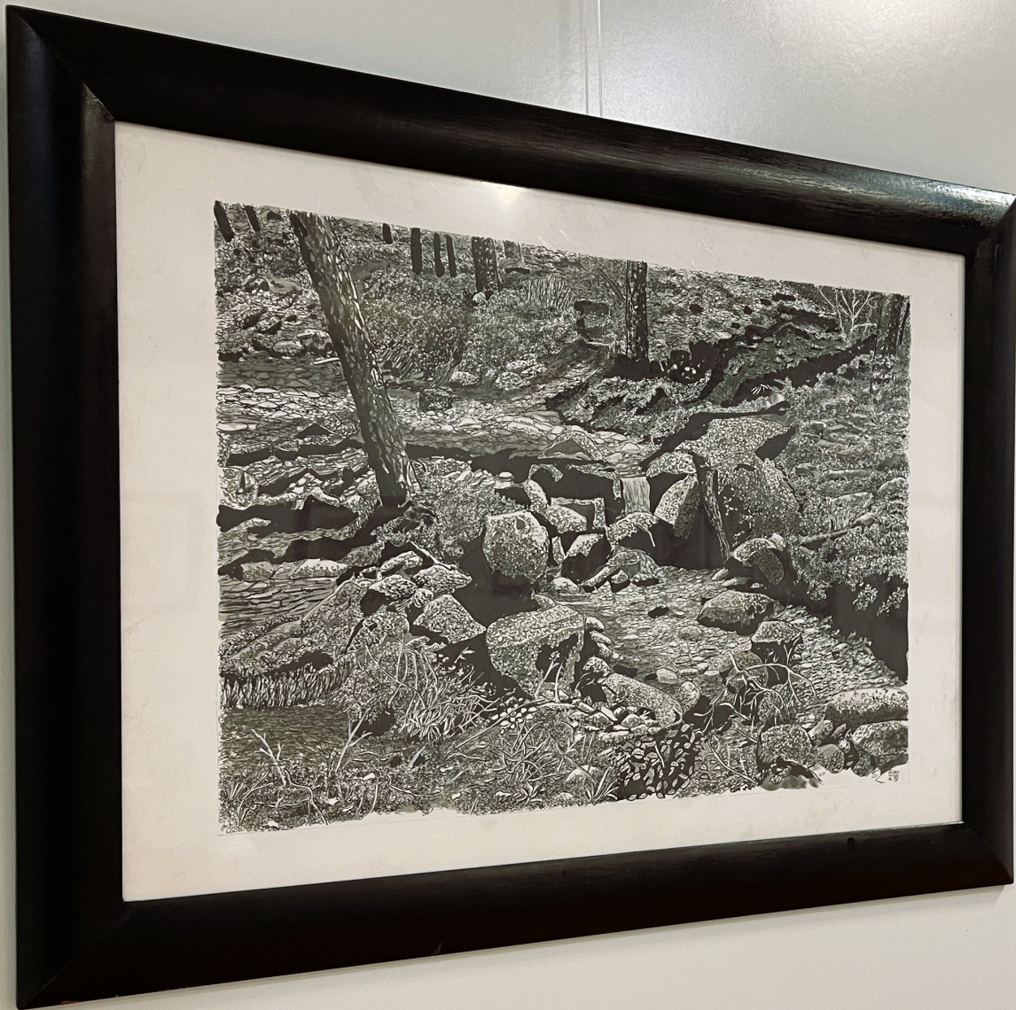
15 "The Stream" by J. M. W. Turner 1842