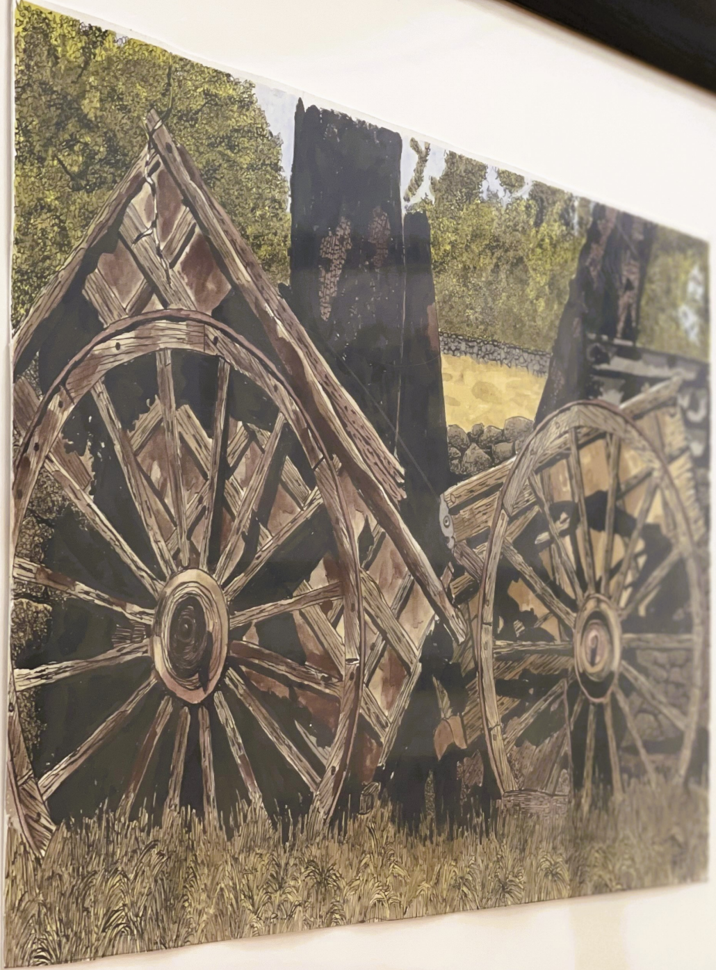
Small white label with illegible text, likely a title or description of the illustration.