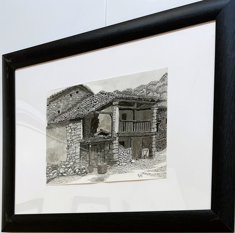
El Museo... "Despoblado de Cantabria" 50 x 70 cm Plumita y tinta china.